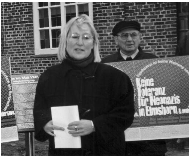
Warnte vor dem Nazi-Terror: Bürgermeisterin Brigitte Fronzek

Auch Elmshorns Bürgermeisterin Dr. Brigitte Fronzek (SPD) wurde von den Neonazis bedroht. Die Täter warfen die Scheiben ihres Privathauses ein und legten Hakenkrallen vor ihre Haustür, um ihr Auto fahruntüchtig zu machen. Doch sie ließ sich nicht einschüchtern.