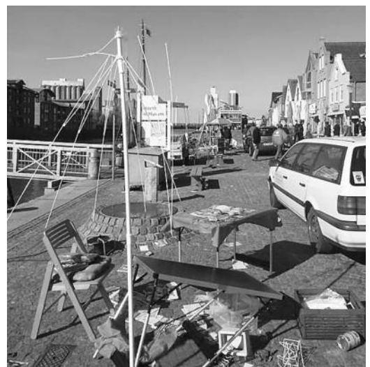
1. Mai in Husum: Zerstörte Infostände

■ Die NPD bietet – mal mehr, mal weniger – allen ihre Strukturen an und den Schutz des Parteienprivilegs