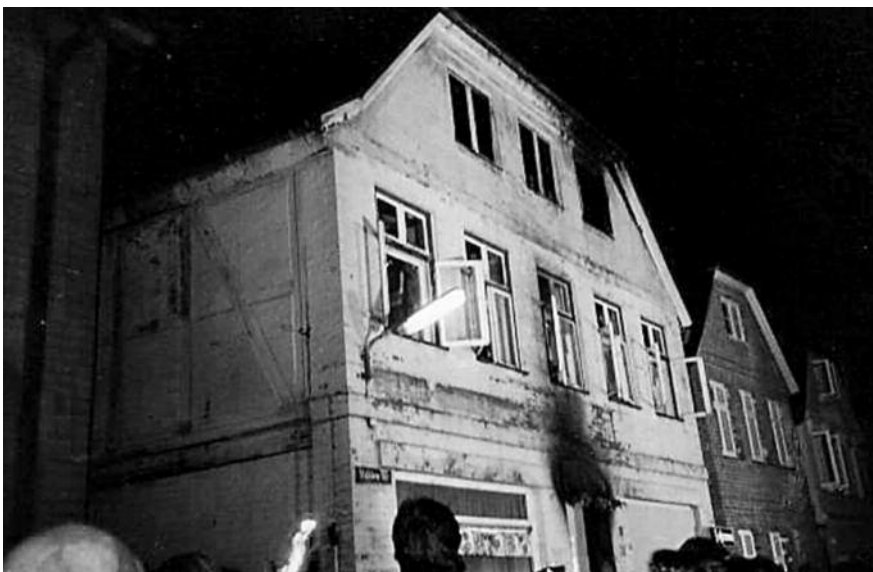
Nach den Brandanschlag in Mölln 1992